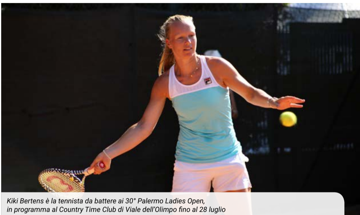
Kiki Bertens è la tennista da battere ai 30° Palermo Ladies Open, in programma al Country Time Club di Viale dell'Olimpo fino al 28 luglio

Oggi sette partite del singolare ed una di doppio. Sessione serale incentrata su Gatto Monticone-Lottner e Pieri-Krunic