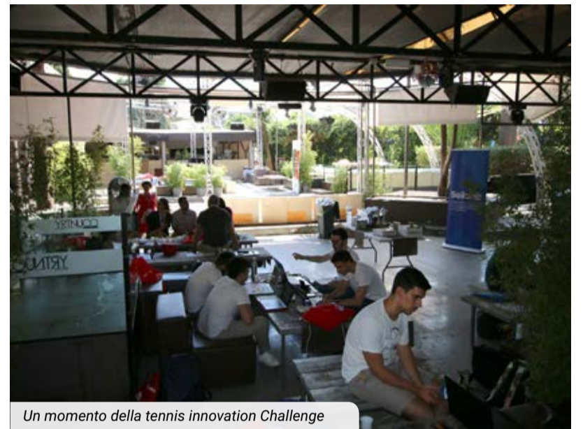
Un momento della tennis innovation Challenge