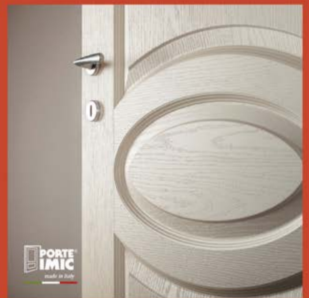
PORTE IMIC UNA STORIA ITALIANA DAL 1956

PICONE SERRAMENTI Cortile Catalano 17/c (trav. di Corso dei Mille) 90121 Palermo