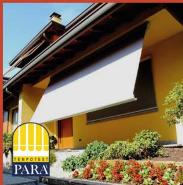
PARÀ TEMPOTEST TENDE DA SOLE